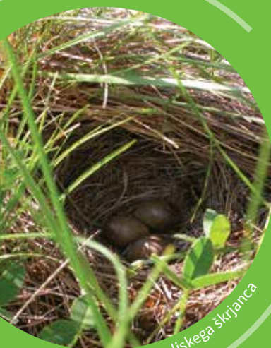
Gnezdo poljskega škrjanca

Tako pomembno pripomorete k ohranjanju življenjskega prostora travniških živalskih in rastlinskih vrst.