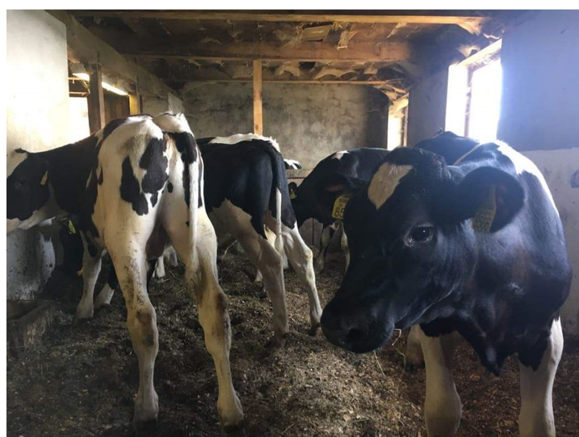
Slika 1: Poskusno pitanje telet - bikcev mlečne pasme.

Zaključek: Pri vsakem rejcu načrtujemo dva pitovna poskusa. Prvi poskus smo zaključili pri treh rejcih. Pri ostalih je prvo poskusno pitanje v teku. V prvem poskusnem pitanju zastavljenih parametrov ne bomo dosegli pri vseh rejcih, v drugem, ponovljenem pitanju pa pričakujemo, na podlagi korekcij tehnologije, doseganje zastavljenih ciljev v celoti. V naslednjem 6-mesečju so načrtovane že prve deseminacije znanja za rejce.